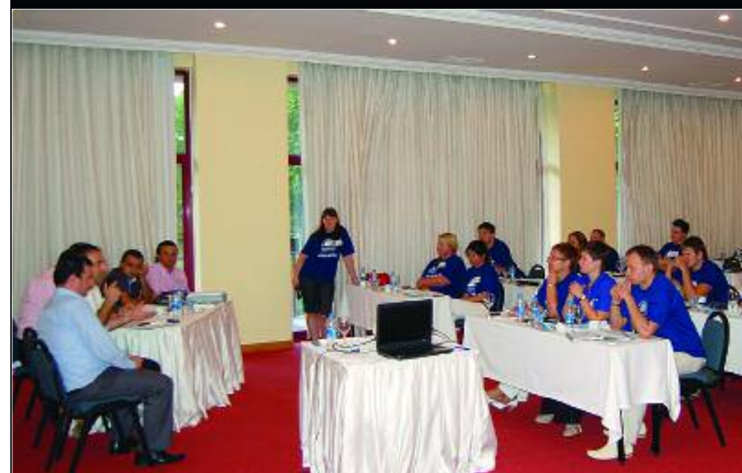
▲ Представители принимающих сторон готовы были ответить на все вопросы