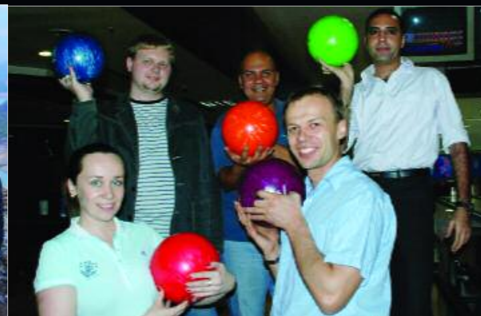
▲ Бизнес и боулинг: увидеть цель, сделать точный удар, радоваться успеху!