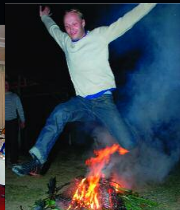
▲ Если сбудутся все желания прыгающих через «интуристский» костер, то компания скоро удивит рынок небывальными объемами