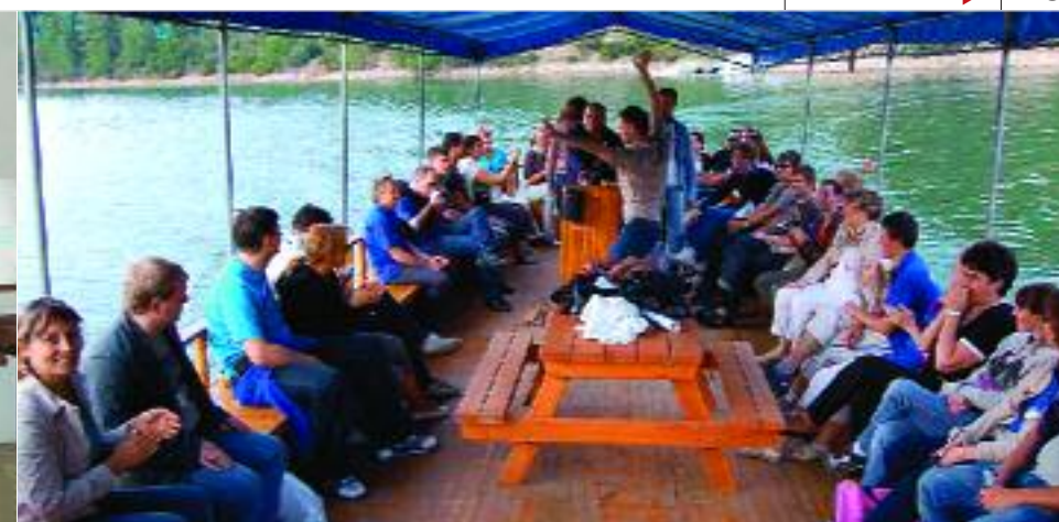
▲ Анталийские пейзажи покорили всех: хотелось петь и танцевать от такой красоты!