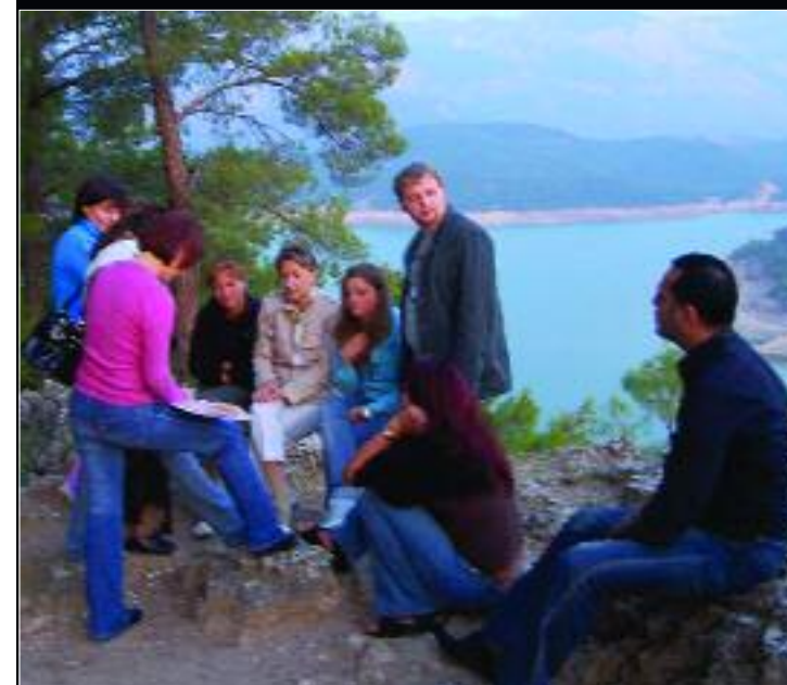
▲ В окрестностях скалистого берега искали клад, а нашли настоящее сокровище – дружбу!